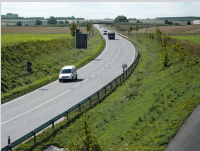
Alle Bilder: Endresultat B 3