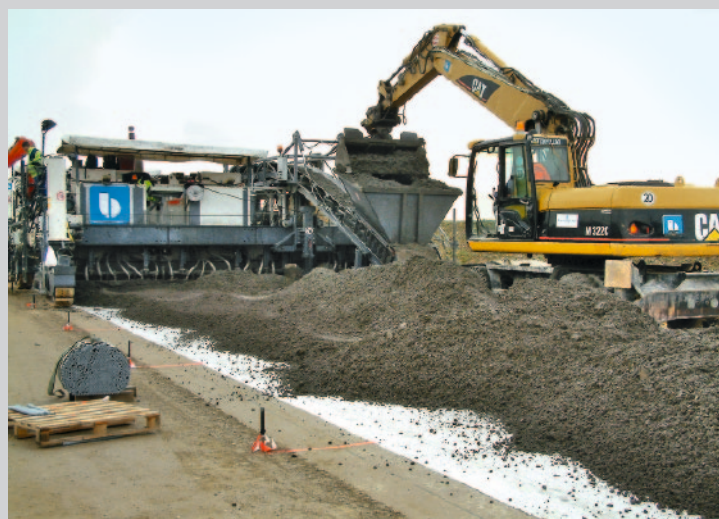
Unterbeton auf hydraulisch gebundener Tragschicht (HGT)