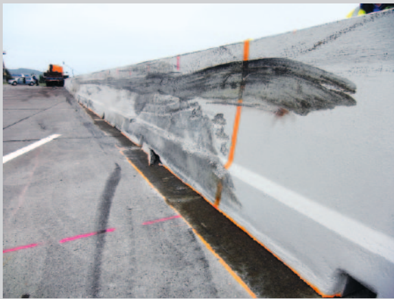
Bild 9: Geringfügige Verschiebung der Betonschutzwand mit besonders hohem Aufhaltevermögen

Sowohl an den Seitenstreifen als auch – und insbesondere – im Mittelstreifen lassen sich durch den Einsatz von Betonschutzwänden bei der Bankettpflege und beim Grünschnitt z.T. deutlich Kosten einsparen. Bedingt durch die geschlossene Bauweise sammelt sich an den Banketten kein Unrat an und die Bankette können nicht «hochwachsen», sodass ein regelmäßiger Bankettabtrag mit Entsorgung des belasteten Materials entfällt [6]. Anfallender Schmutz kann durch Abkehren einfach entfernt werden. Bei zweiseitiger Schutzeinrichtung aus Beton im Mittelstreifen ist ein Grünschnitt seltener und einfacher durchzuführen. Bei nicht bepflanzten Zwischenräumen entfällt der Grünschnitt vollständig (Bild 11).