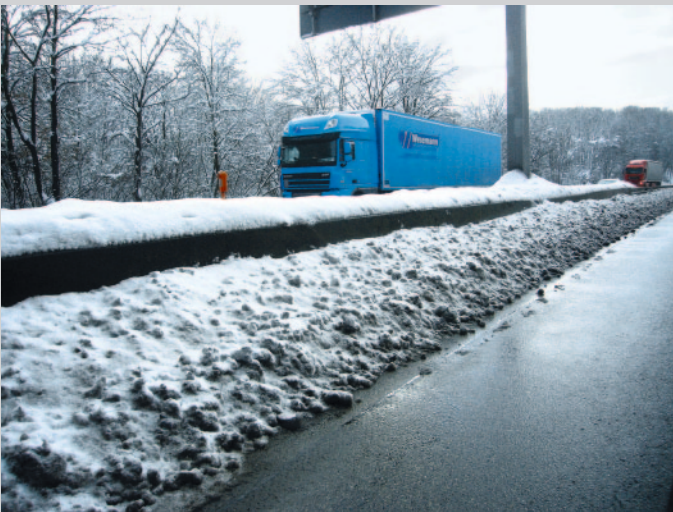
Bild 12: Schneebedeckte Betonschutzwand im Mittelstreifen auf der A 46