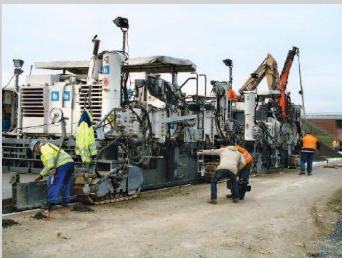
Fertigerzug im Einsatz