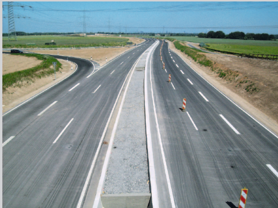
Bild 11: Mittelstreifen, der nicht zur Bepflanzung vorgesehen ist