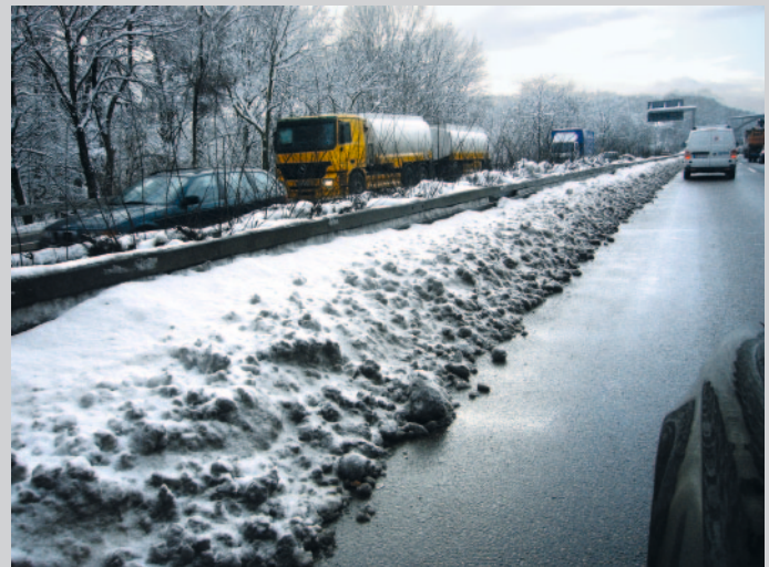
Bild 13: Schneebedeckte Stahlschutzplanke im Mittelstreifen auf der A 46