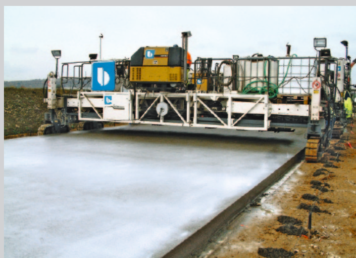
Aufsprühen eines flüssigen Nachbehandlungsmittels