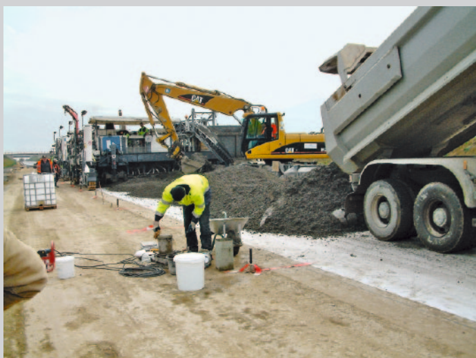
Prüfung des Unterbetons

Die kontinuierliche, störungsfreie Belieferung der Baustelle mit gleichmäßigen Betoneigenschaften aus drei unterschiedlichen Transportbetonwerken hatte dabei oberste Priorität. Der angelieferte Beton (Oberbeton: Gesteinskörnungen 0/2, 5/8, LP, CEM I 42,5 N; Unterbeton: Gesteinskörnungen 0/2, 2/8, 8/16, 16/22, LP, CEM I 42,5 N) wurde während des Einbaus fortlaufend geprüft, um eine gleichbleibend gute Qualität zu gewährleisten. Dies galt insbesondere für die Ausgangsstoffe, die Konsistenz und den Gehalt an Mikroluftporen im frischen Beton – einer wichtigen Kenngröße für den Frost- und Tausalz widerstand eines Straßenbetons.