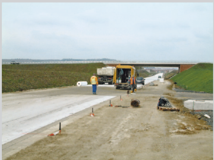
Geotextil auf hydraulisch gebundener Tragschicht (HGT)