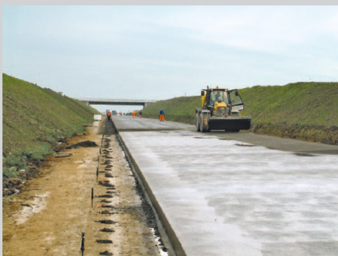
Ausbürsten zur Waschbetonoberfläche