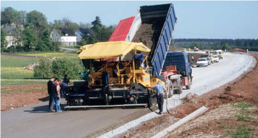
Bild 7: Erprobungsstrecke «Walzbeton als Tragschicht mit dünnem Asphaltbelag» auf der B 54 im Westerwald

deckung vorzubeugen, wurde der Kerbabstand in der Tragschicht auf 3 m festgelegt. Ziel war es, eine möglichst geringe Öffnungsweite und damit eine gute Rissverzahnung in den nicht verdübelten Kerben zu erreichen. Die Schnitttiefe betrug 8 cm. Die Rissbildung in den Kerben wurde durch Vibrationswalzenübergänge angeregt.