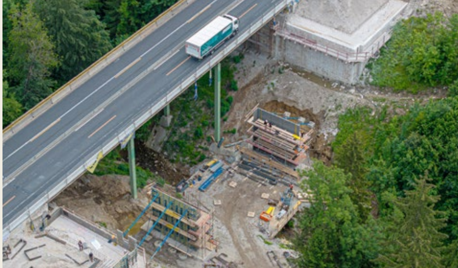
Die Generalsanierung wurde bei laufendem Verkehr durchgeführt, zudem wurden 28 Brücken erneuert wie hier die Ölgrabenbrücke.