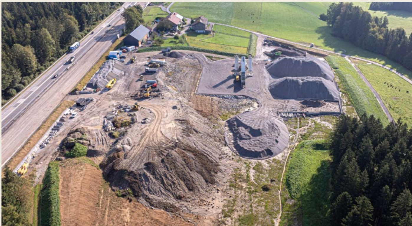
Der Betonbruch wurde direkt auf der Baustelle so aufbereitet, dass die Recycling-Gesteinskörnung nach der Aufbereitung der Körnung eines normalen Kieswerks entspricht.

Bei der Generalsanierung der der A1 West Autobahn im Streckenabschnitt Mondsee–Thalgau wurde erstmals ein Re-Recycling der Betondecke umgesetzt. Dafür wurde das Projektteam von der European Concrete Paving Association, EUPave, mit dem Outstanding Project Award ausgezeichnet.